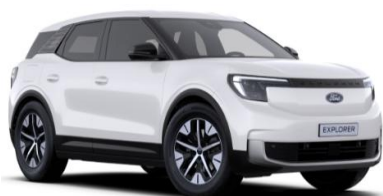
Frozen White nemetalická

● štandardná výbava — nie je k dispozícii