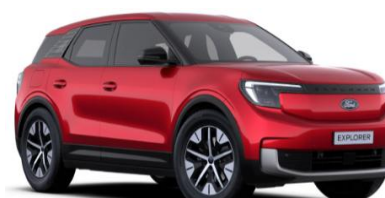
Lucid Red prémiová metalická