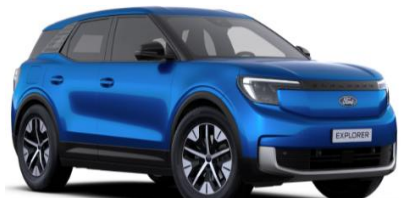
Blue My Mind prémiová metalická