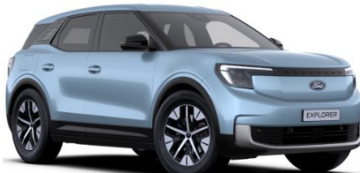
Arctic Blue metalická