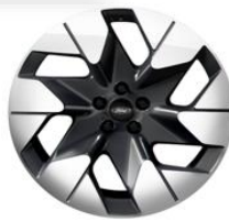
20" zliatinové disky šedá Magnetic Línia výbavy Premium