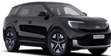
Agate Black metalická