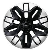
21" zliatinové disky čierna Asphalt Matt Voliteľne