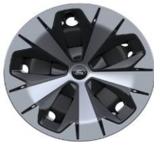
19" oceľové disky s celoplošnými aero. krytmi