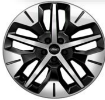
19" zliatinové disky čierna Absolute Línia výbavy Explorer