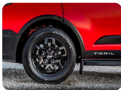
Verzia Trail (ilustračné foto)