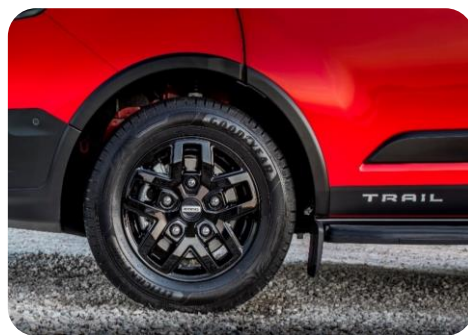
Verzia Trail (ilustračné foto)